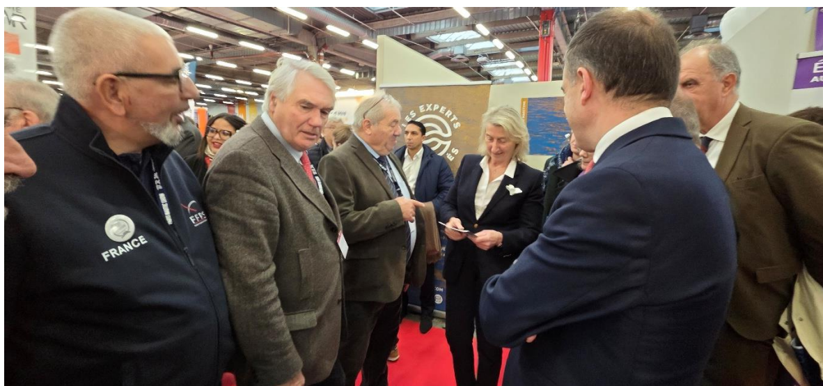
Madame Chabaud Ministre de la Mer

Par ailleurs, la CM&L a eu un entretien avec la Ministre qui s'est montrée réceptive sur la création d'un guide simplifié sur le renouvellement des ZMEL. Pour ce qui est du dossier de la Taxe Annuelle sur les Engins Maritimes à Usage Personnel (TAEMUP), Mme Chabaud ne désire pas intervenir.